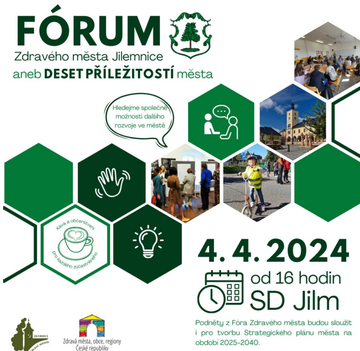
Obrázek 1 Pozvánka na Fórum ZM