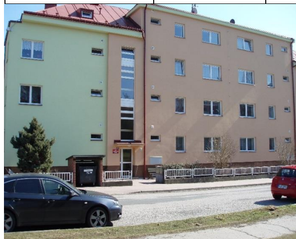
Byty bez výtahu č.p. 482,483,