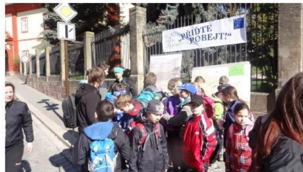
Zpracovala: Ing. Petra Novotná, odbor rozvoje, investice a majetku leden 2017