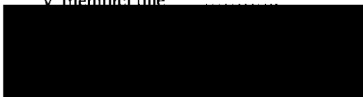
Bc. David Hlaváč starosta města Jilemnice