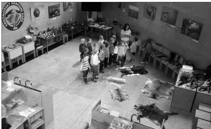
Výlet nejen za „Sušenkou“.

Ověřování bude probíhat v rámci činnosti dětí ve školní družině. Vedoucími