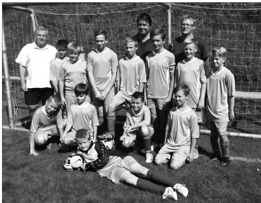
Fotbalisté – konec sezóny.