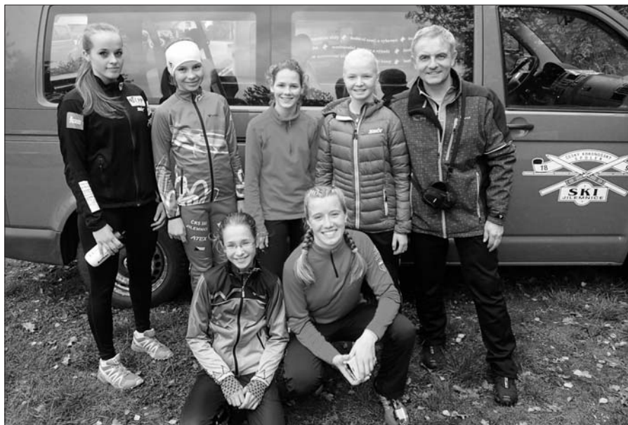
Přespolní běh – dívky.

Celý seriál se skládá ze šesti započítávaných přespolních běhů, které organizují lyžařské oddíly v rámci celého Libereckého kraje. Nejprve se běželo na tratích v Harrachově, dále potom ve Studenci, Tanvaldu, Bedřichově, Jablonci n. N. a Liberci-Vesci. Pohár byl hodnocen v šesti kategoriích od nejmladšího ročníku 2008 až po nejstarší běžce ročníku 2003, vždy pro chlapce a dívky. Do soutěže družstev se započítávají body vždy 20 nejlepších závodníků.