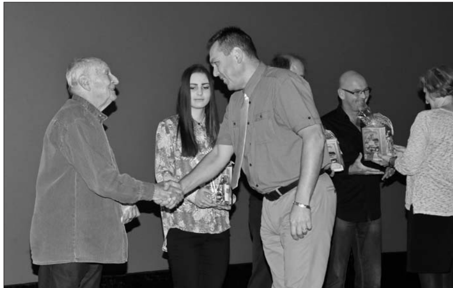
Na premiéře filmu o Jilemnicích.

Obavu snad ani ne. Jen bylo potřeba na natáčení zajistit celý mladý tým Televize Krkonoše. Protože natáčení probíhalo ve dny školní výuky a já byl také u maturitních zkoušek. Naštěstí jsme