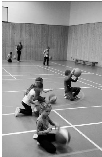
Hodina pohybu navíc.

Městská knihovna připravila na měsíc prosinec v rámci pořadu KaMaRáDka