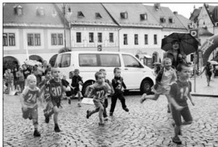
Lízátkové závody.