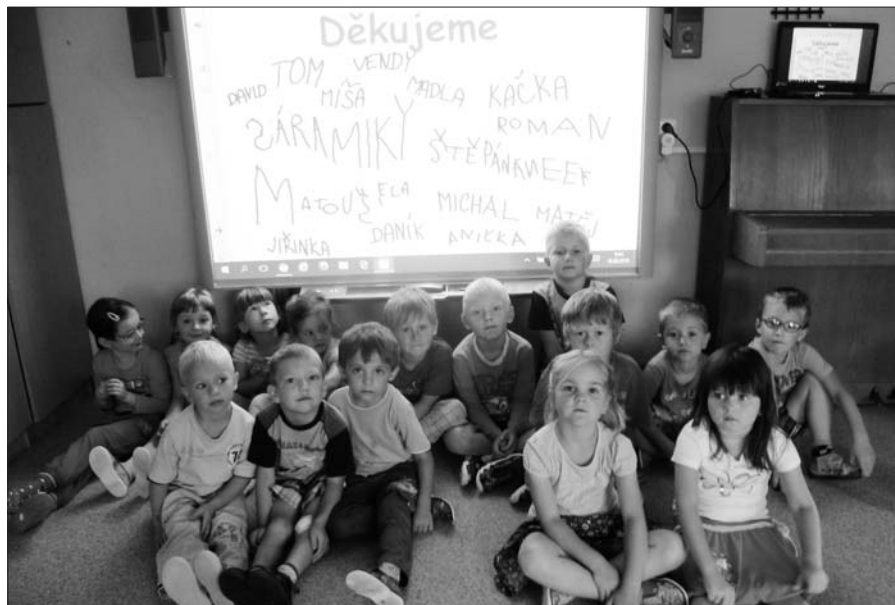
Ohlédnutí za oslavami 50. výročí.

Jelikož se jednalo o kulaté výročí, chtěli jsme si nadělit i dáreček. Oslovili jsme sponzory i návštěvníky akce a požádali je o finanční příspěvek na zakoupení interaktivní tabule. Touto cestou