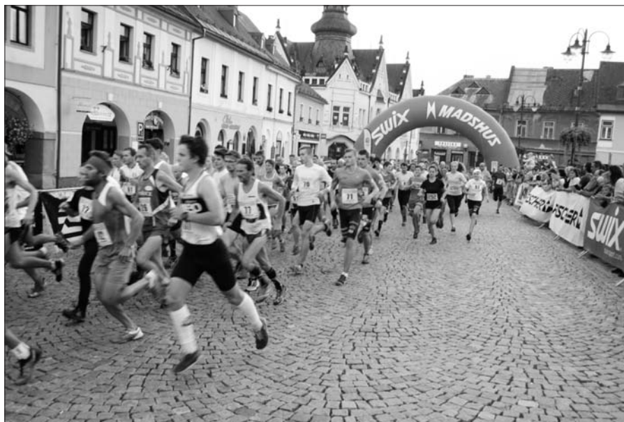
Start hlavního závodu.

Hned po odstartování hlavního běhu na Žalý přišly na řadu žákovské závody v rámci Běhu zámeckým parkem. Tento závod letos nebyl součástí krajského poháru Libereckého kraje v přespolních bězích žactva, což se projevilo,