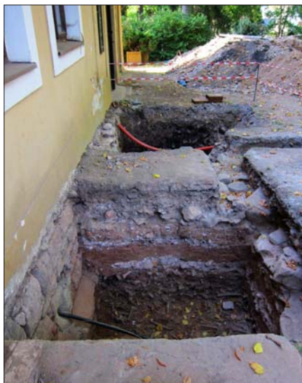
Sondy před zahradním domkem.

V měsíci září probíhal v areálu zámeckého parku i v okolí zahradního domu předstíhový archeologický výzkum, který zajistilo archeologické oddělení Muzea Českého ráje ve spolupráci se servisní organizací TerraVerita, spol. s r. o. Před východním průčelím pivovarského domu byly vyhloubeny sondy, které předcházely plánovaným terénním úpravám a stavbě opěrné zdi. Tyto sondy prokázaly, že původní terén zámeckého parku byl nejméně o jeden až dva metry navýšen, a dále v nich byla objevena linie původní tarasní zdi, která od 17. století staticky zajišťovala komunikaci před pivovarským domem. Mezi zajímavé objevy patří kupříkladu i vyzděný kanál překrytý velkými fylitovými deskami, který souvisel s provozem pivovaru.