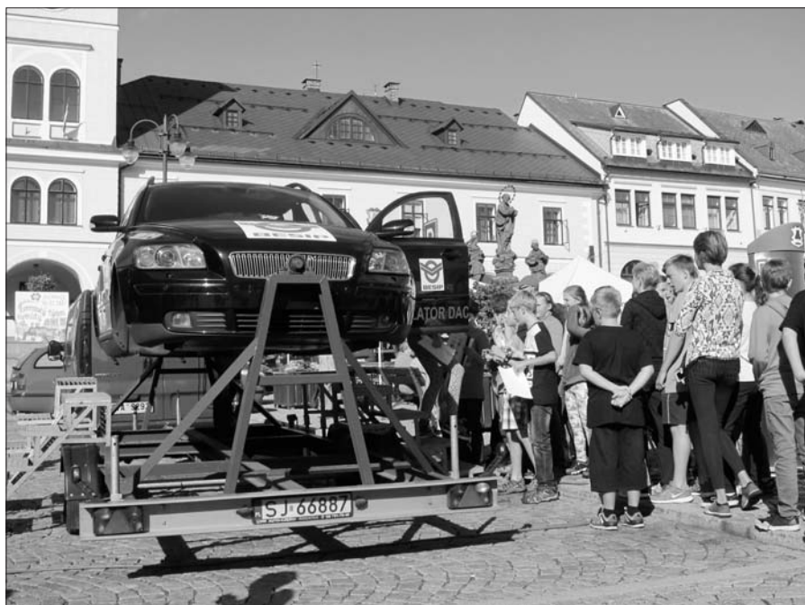
Otočný simulátor nárazu.