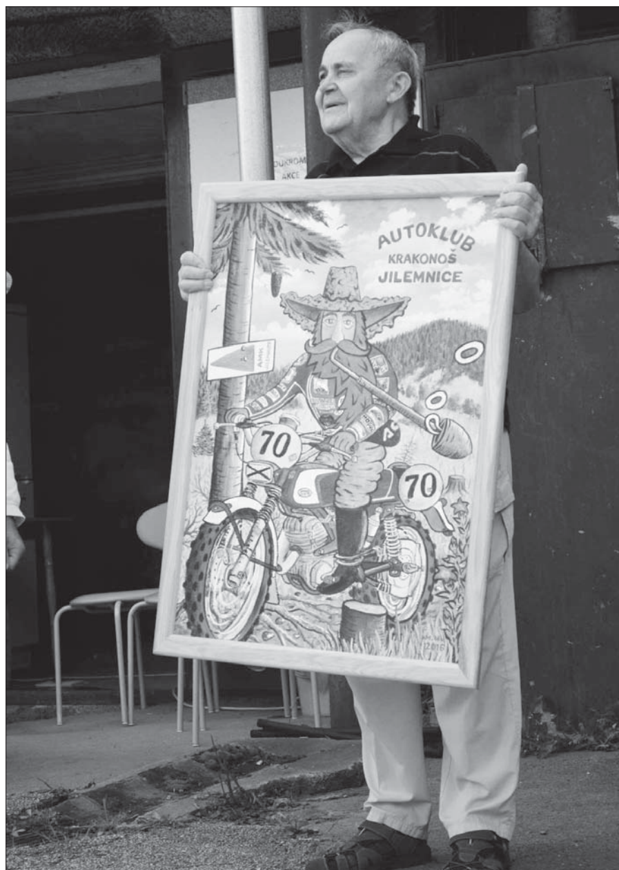
AK Krakonoš slavil...