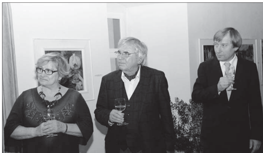
Vzácná vzpomínka – Věra Čáslavská v Krkonošském muzeu v Jilemnici v roce 2013. Setkání, na něž se nedá zapomenout.

► Slavnostní bohoslužba k 280. výročí posvěcení jilemnického chrámu sv. Vavřince v Jilemnici se uskutečnil v neděli dne 2. října v 9 hodin. V provedení chrámového sboru zazní vynikající Misa in E od jilemnického rodáka Stanislava Macha (1906–1975). Letos si připomínáme 110. výročí narození tohoto významného skladatele a hudebního pedagoga. Srdečně zveme k účasti.