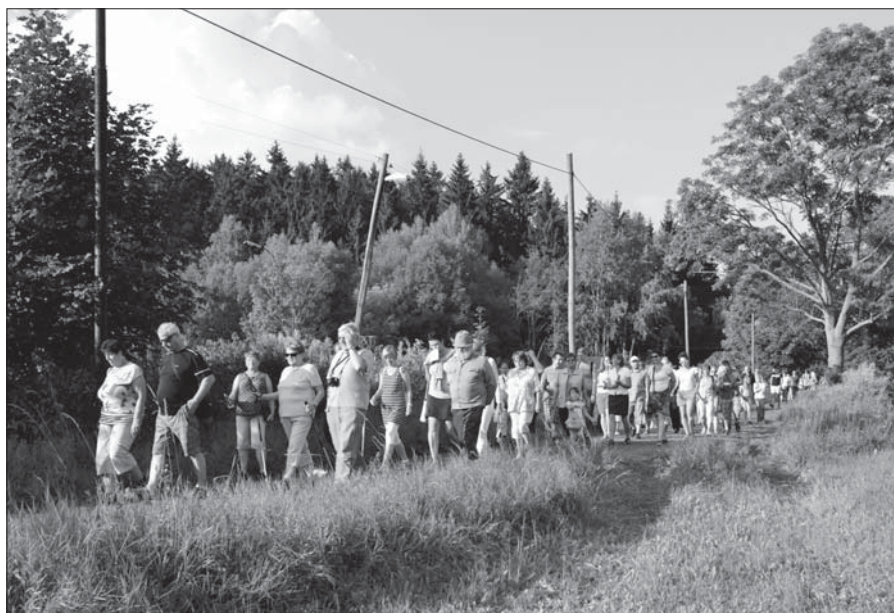
Z otevření Stezky Františka Kavána.