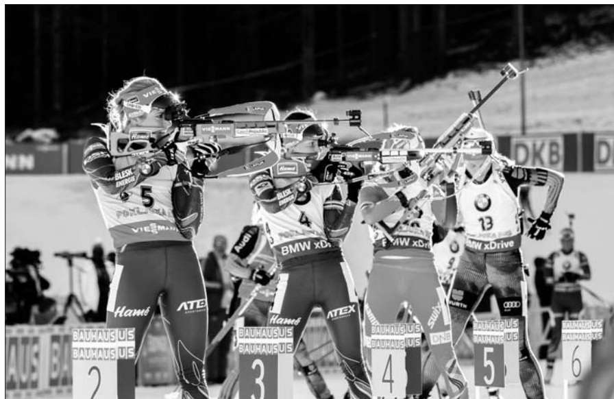
Gabriela a Veronika při stíhačce.