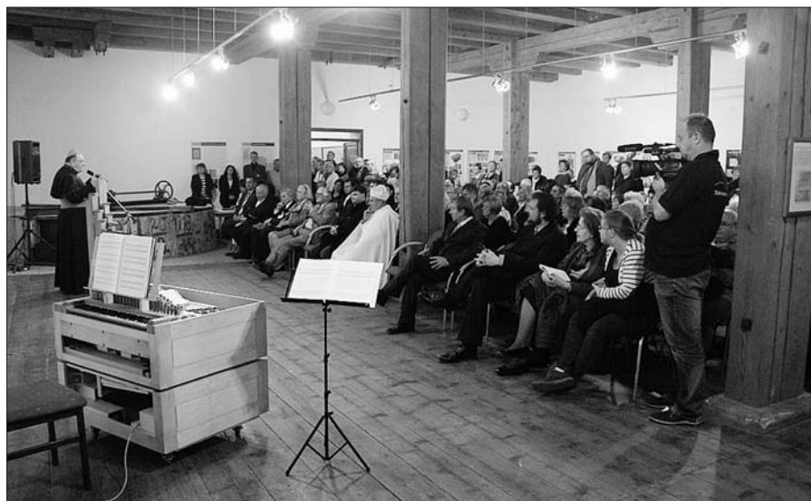
Z vernisáže výstavy Mezi Prahou, Vídní a Římem .