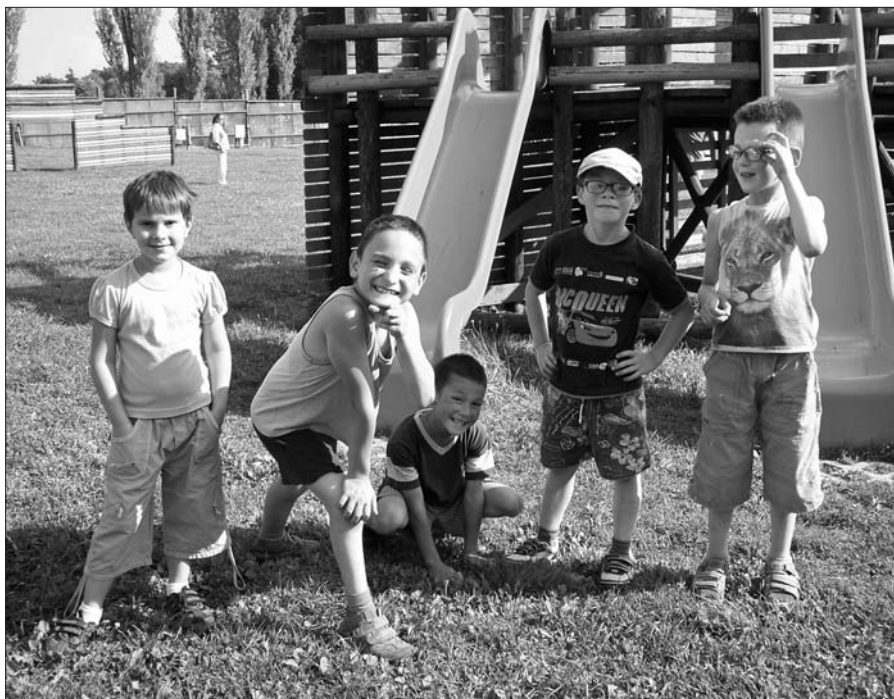
Setkání pěstounských rodin.

www.janatumlyn.cz , kontakt: jana-tumlyn@email.cz , tel.: 603 260 319