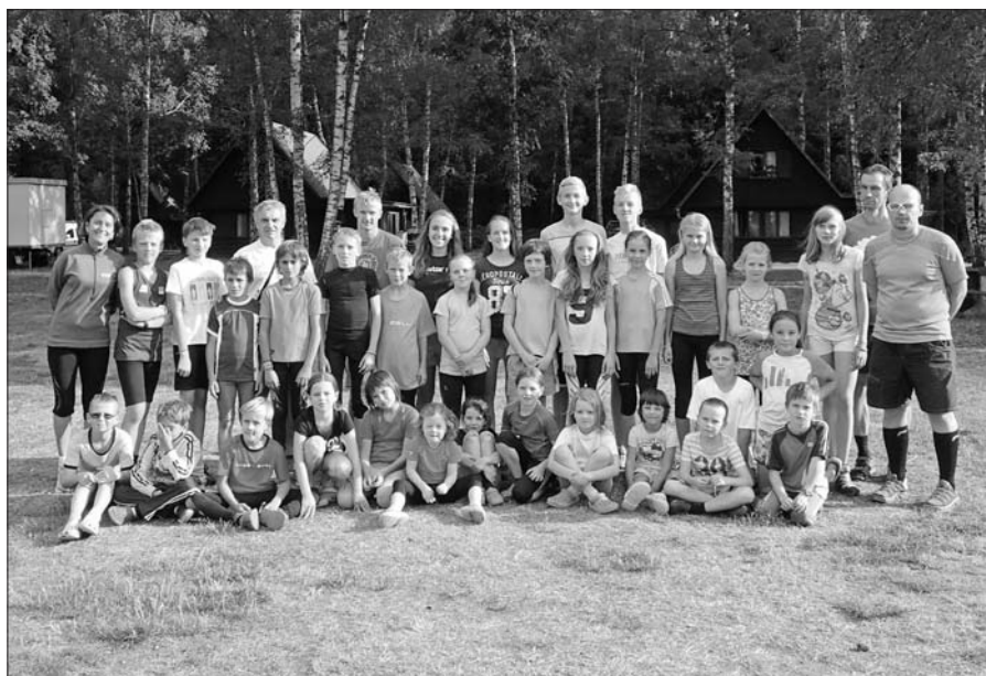
Soustředění mladých lyžařů na Stříbrném rybníku.