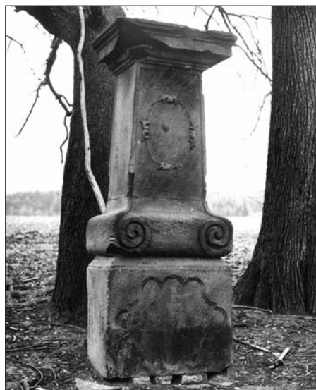
Zničená socha Karla Velikého, rok 1992.