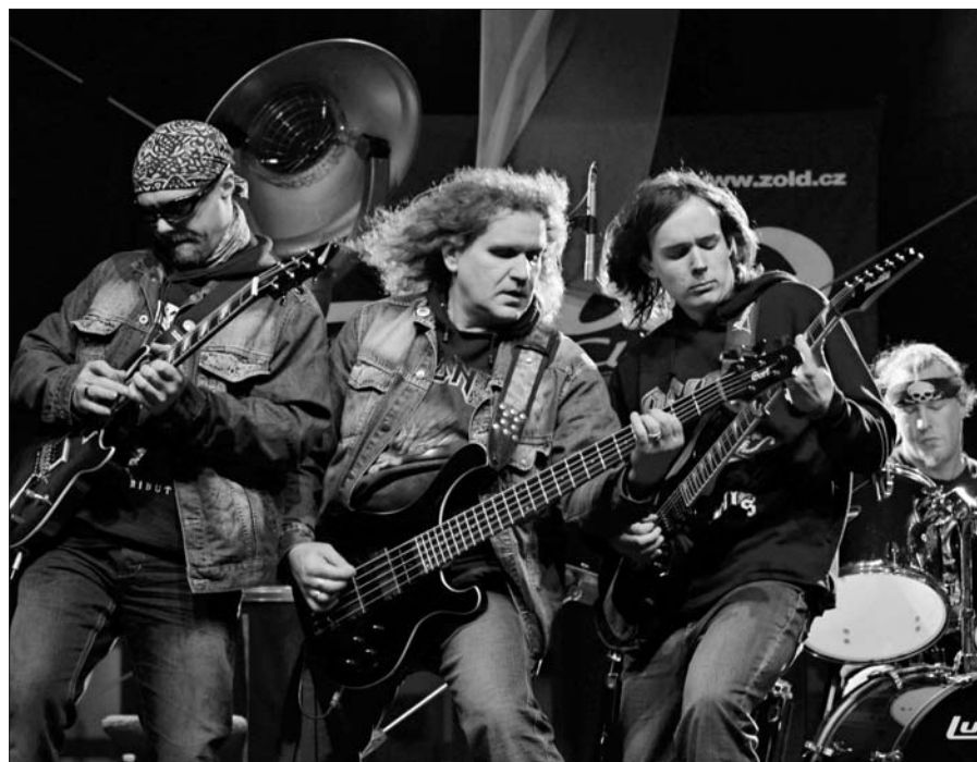
Dny česko-polské kultury – z akce v Karpaczi dne 28. 12. 2013.

► Upozornění. Články do zpravodaje zasílejte na e-mailovou adresu: zpravodaj@mesto.jilemnice.cz