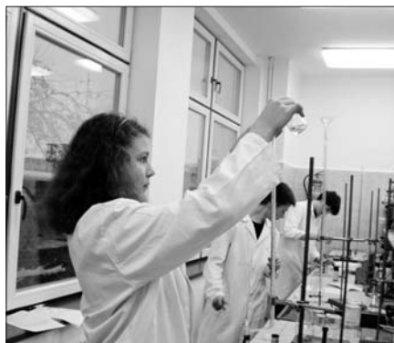
Z archivu gymnázia

Při propagaci naší školy nelze zapomenout, že naše škola je přínosem