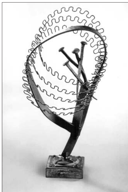
Tvořivé cesty jedné rodiny.