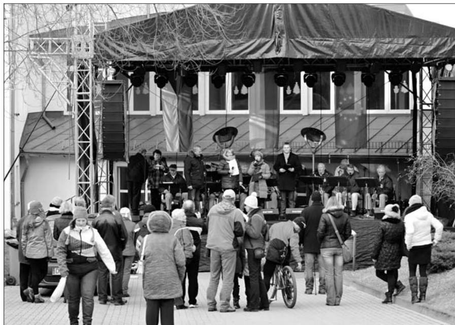
Dny česko-polské kultury – z akce v Karpaczi dne 28. 12. 2013.