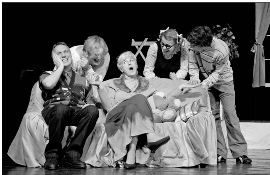
Zmatek v penzionu Domov.