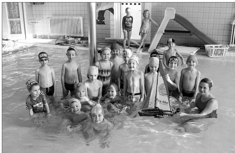
Sluníčka z MŠ Komenského ve Vrchlabí v jilemnickém bazénu.