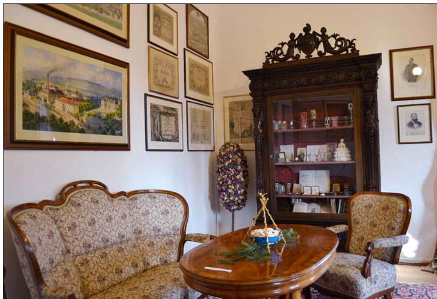
Harrachovský interiér v jilemnickém zámku.

Co se všechno v roce 2012 podařilo? Projekt revitalizace významných částí městské zeleně (tedy historického zámečského parku, parku u nemocnice a doprovodné aleje) byl spolufinancován z Operačního programu životního prostředí, formálně bude zakončen počátkem roku 2013. Ve spolupráci s partnerskými městy Karpacz a Kowary jsme z „přeshraniční“ spolupráce revitalizovali sokolský park. Obdobně partnerská města renovovala své parky. Obě akce a čtyři parky s doprovodnými prvky stály bezmála 18 mil. Kč. To však nebyly jediné projekty, jež se týkaly zeleně. Byli jsme úspěšní i v projektu zalesňování ploch městských lesů,