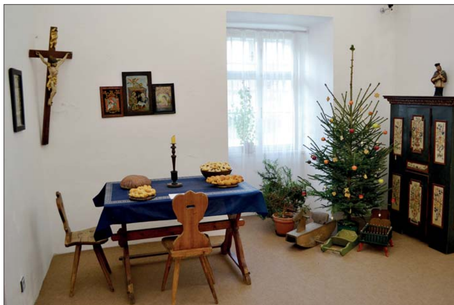
Vánoční výstava v jilemnickém zámku.