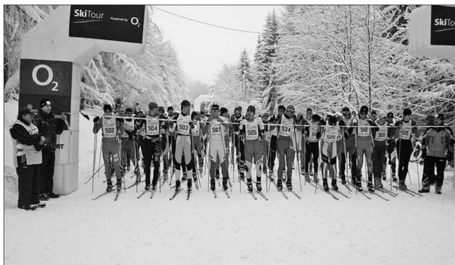
Start Jilemnické 50 v roce 2012.