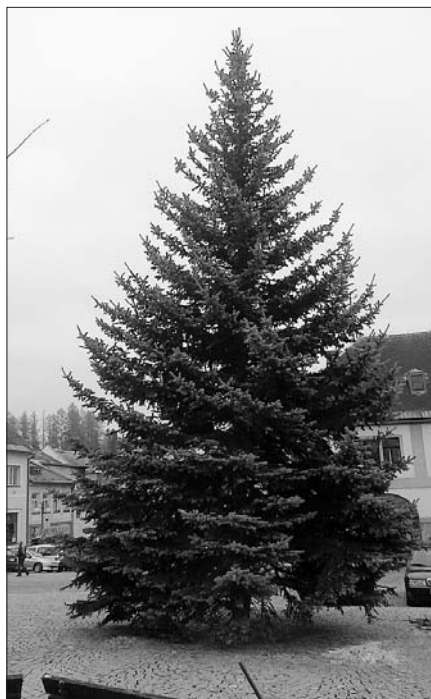
Letošní vánoční strom.

Ve všech výstavních prostorách a v zámecké expozici probíhá výstava Krkonošské Vánoce .