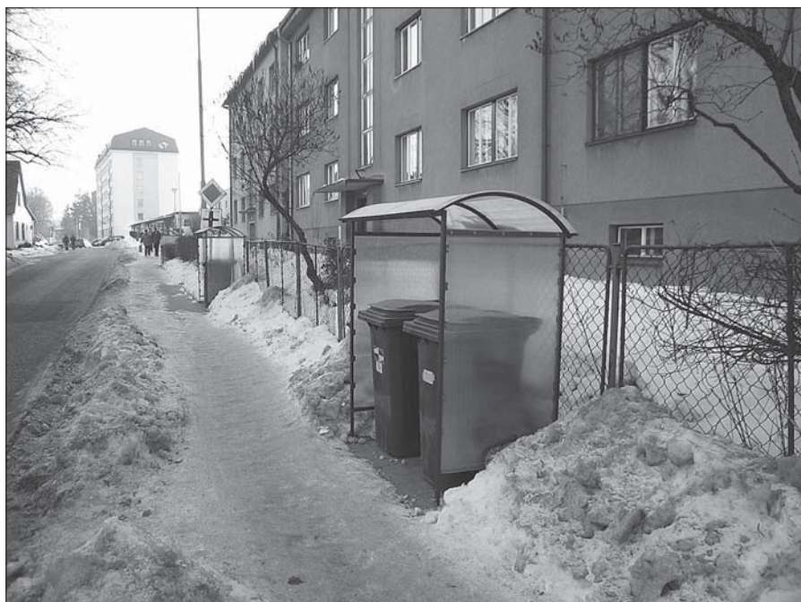
Nové plastové kryty popelnic.