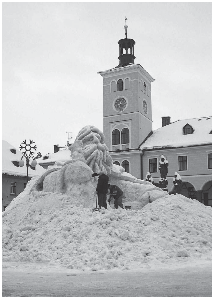
Jak se stavěl letošní Krakonoš.