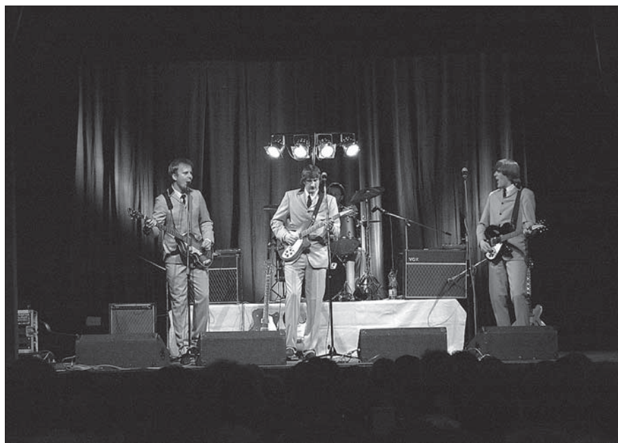
Z vystoupení skupiny Brouci.