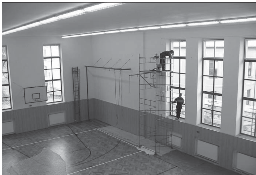
Velký sál sokolovny a ochrana oken sítěmi.