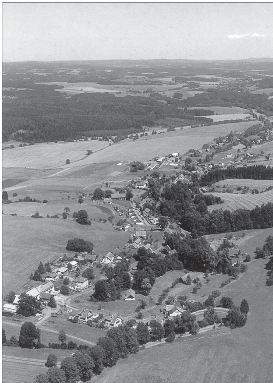
Bukovina u Čisté