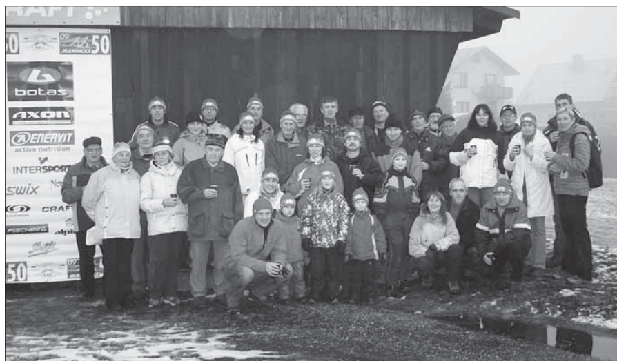
Silvestrovský přítpek 2009.