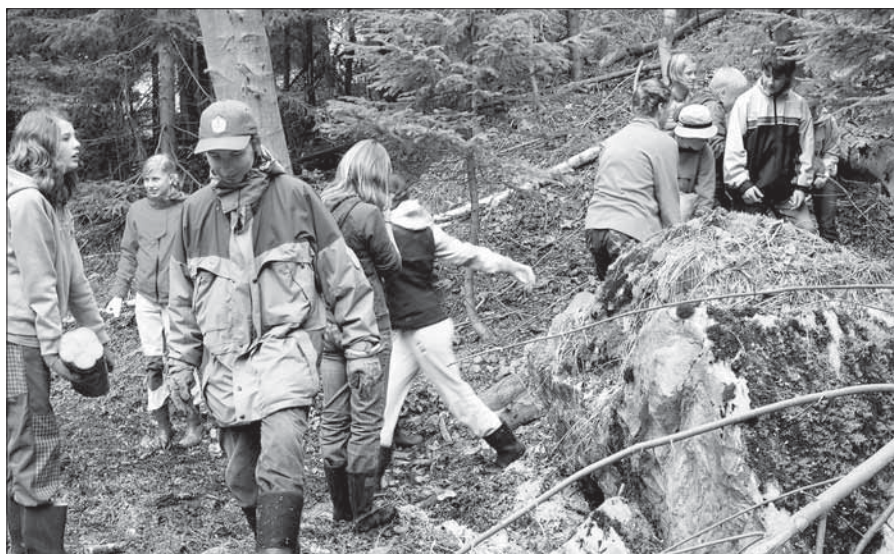
Čištění lomu ve Strážném.