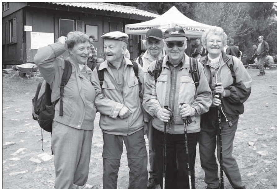
Výstup na Žalý 2010.

Žádáme autory, aby příspěvky do zpravodaje dodávali nejpozději v den uzávěrky. Na příspěvky dodané později nebude brán zřetel a zařadíme je, pokud budou ještě aktuální, až o měsíc později. Uzávěrka prázdninového dvojčísla se koná v pátek dne 11. června 2010.