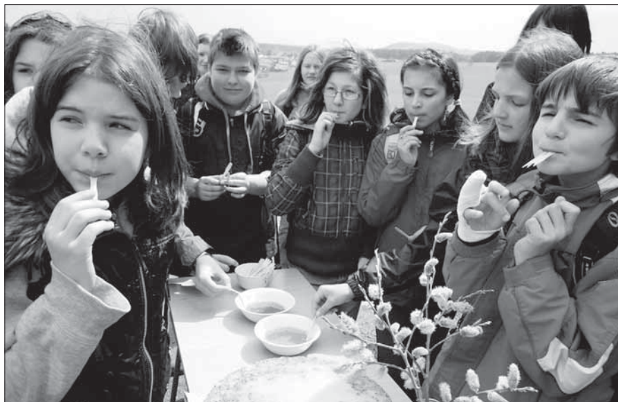
Z letošního Dne Země.