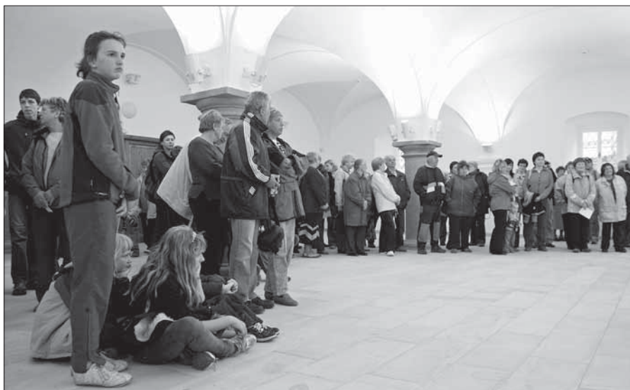
Den otevřených dveří v čp. 1.

Slavnostní otevření objektu proběhne 30. září 2010. Následně bude zahájena provozní etapa projektu – otevře se