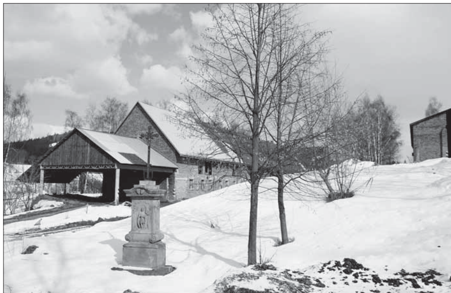
Zrestaurovaná Boží muka v Hrabachově.

Od majitelů pozemku, na kterém kříž stojí, jsem se dozvěděla i něco ze starší historie této památky. Původně stávala u staré cesty z Jilemnice do Vrchlabí, byla to ve své době (až do roku 1912) hlavní cesta z Hrabachova do Valteřic. Boží muka tu sloužila poutníkům i cestujícím k jejich potěše a povzbuzení po dlouhé desítky let. I později, když již cesta přestala svou funkci plnit, těšila se Boží muka stále ještě úctě a zachovávala si svoji důstojnost. Později byly ovšem v místě cesty postaveny budovy pro chov hovězího skotu a celou lokalitu začalo využívat tehdejší JZD. Boží muka přestala stát u cesty, stála najednou v jakémsi koutu a v místě, kam si uživatelé tehdejšího statku zvykli odkládat nejrůznější odpad – např. těžké betonové pane-