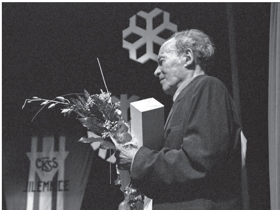
Jaroslav Cardal při přebírání ocenění.

Narodil se 16. března 1919 a v roce 1939 maturoval na jilemnickém gymná- ziu. Patřil mezi nadané studenty a jedině uzavření českých vysokých škol němec- kými okupanty mu neumožnilo pokračovat dále ve studiu. O to více se však věnoval svému koníčku – běžeckému ly- žování a svůj nepopíratelný talent k to- muto sportu zúročil nebyvalou a velice náročnou tréninkovou přípravou. A ta jej vynesla k 25 mistrovským titulům v závodech jednotlivců a trojnásobné- mu mistrovskému titulu ve štafetách. Byl účastníkem tří ZOH a dvou MS. Mezi jeho největší sportovní úspěchy patří 13 vítězství za sebou v běhu na 50 km v le- tech 1947–59. Svoji poslední padesát- ku v roce 1959 vyhrál již ve svých 40 le- tech, kdy porazil o 15 i více let mladší