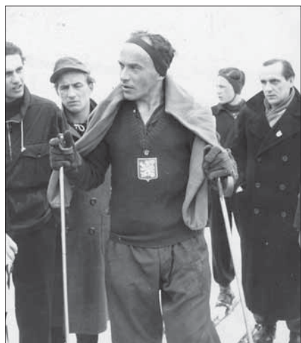
Se lvíčkem na prsou.