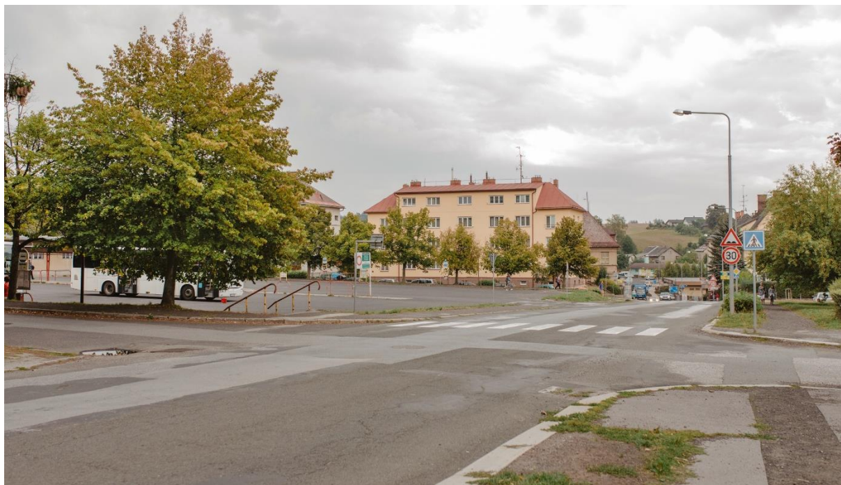
Při I. etapě rekonstrukce bude uzavřeno autobusové nádraží, které se přesune do ulice Krkonošská.

9. 4. 2019 - V dubnu se v Jilemnici rozeběhne největší investiční akce roku plánovaná společně s Libereckým krajem – rekonstrukce Žižkovy ulice. Město se na ní bude podílet částkou 18 mil. Kč. Vítězem veřejné zakázky na realizaci této investice se stala firma M-silnice a.s. Pardubice.